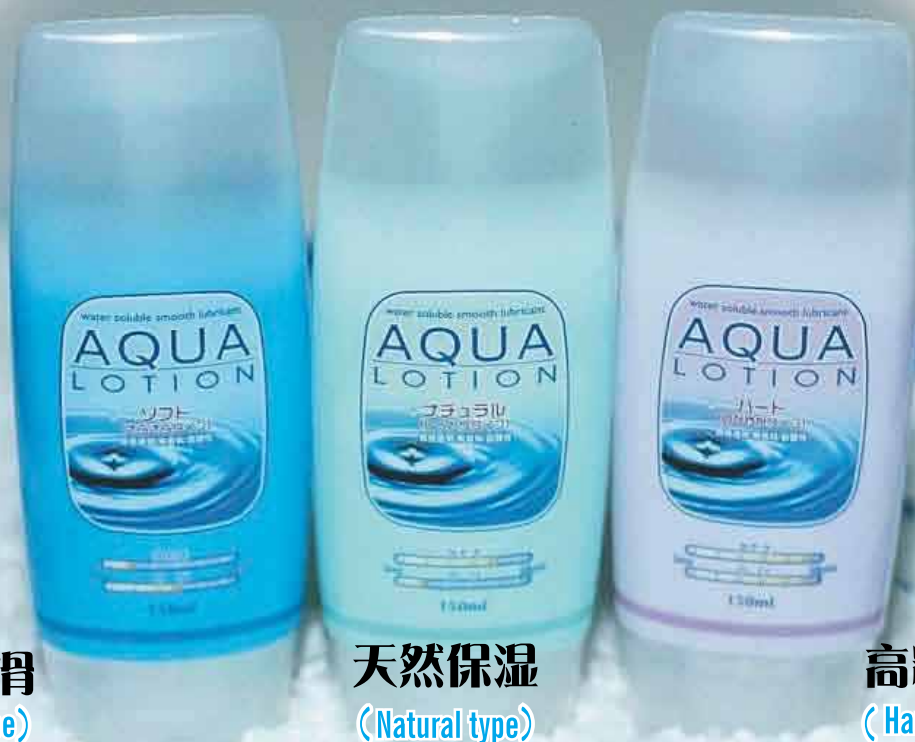
超润滑 (Soft type)